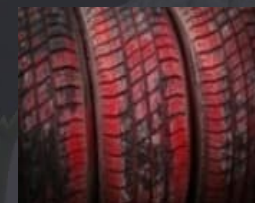
ゴム - タイヤ、伝動ベルト、その他のゴム製品