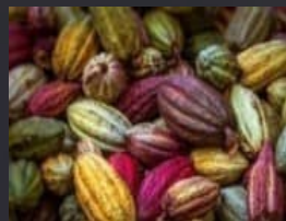
ココア - 豆、殻、カカオバター、チョコレート