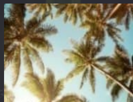
アブラヤシ - パーム油、ナッツ、種子、グリセロール、パルミチン酸、ステアリン酸