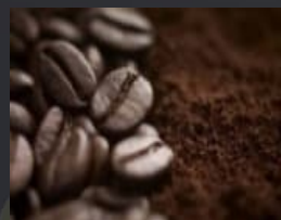
コーヒー - 豆、殻